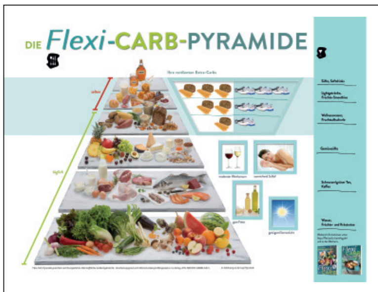
Abbildung 4: Symbolische Darstellung für die optimale Zusammenstellung der Nahrung

Die Betriebsverpflegung hat in den letzten Jahren deutlich an Angebotsvielfalt gewonnen. Individuelle Wünsche der Beschäftigten können durch freie Wahl der Menükomponenten erfüllt werden. Besondere Schwerpunkte wie saisonale Spezialitäten, Fisch oder Aktionswochen können das Speisenangebot sinnvoll ergänzen.