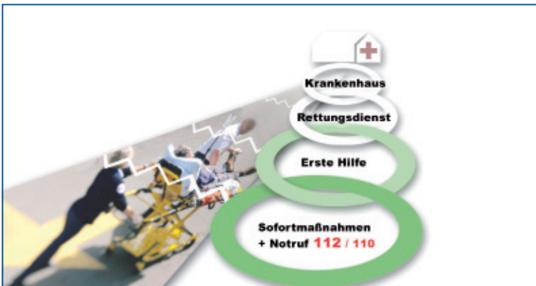
Abbildung 2: Die Rettungskette

Wenn Menschen Hilfe brauchen, sei es durch einen Unfall oder durch die Folgen einer Erkrankung, müssen im Vorfeld geeignete Vorkehrungen getroffen worden sein. Die einzelnen Schritte der Hilfe greifen dabei wie Glieder einer Kette ineinander und sorgen dafür, dass Betroffene schnelle Hilfe – bis hin zur Behandlung im Krankenhaus – erhalten. Die Bedeutung der Ersten Hilfe zeigen die wichtigsten zwei Glieder der Rettungskette: Sofortmaßnahmen plus Notruf und Erste Hilfe (siehe Abbildung 2).